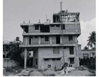
ನಿರ್ಮಾಣ ಹಂತದಲ್ಲಿರುವ ಕಟ್ಟಡ ಕಾಮಗಾರಿ

ಕರ್ನಾಟಕ ಆರ್ಯವೈಶ್ಯ ಮಹಾಸಭೆಯ ಮತ್ತೊಂದು ಮಹೋನ್ನತ ಯೋಜನೆ ಮೈಸೂರು ನಗರದ ಹೃದಯ ಭಾಗದಲ್ಲಿರುವ ಗೀತಾಮಂದಿರ ರಸ್ತೆಯಲ್ಲಿ ತಲೆ ಎತ್ತುತ್ತಿದೆ. ಈ ಯೋಜನೆಯಲ್ಲಿ ವಿದ್ಯಾರ್ಥಿಗಳಿಗೆ, ವಿದ್ಯಾರ್ಥಿನಿಯರಿಗೆ ಹಾಸ್ಟೆಲ್ ಸೌಲಭ್ಯಗಳನ್ನು 2023-24ರ ಶೈಕ್ಷಣಿಕ ವರ್ಷಕ್ಕೆ ನೀಡಲು ಮಹಾಸಭೆ ಉತ್ಸುಕವಾಗಿದೆ. ಇದೇ ಕಟ್ಟಡದಲ್ಲಿ 18 ಸುಸಜ್ಜಿತ ಅಧಿತಿಗೃಹಗಳು ಮತ್ತು ಸಾಮೂಹಿಕ ವಸತಿ ವ್ಯವಸ್ಥೆಗೆ ಡಾರ್ಮೆಟರಿಯೂ ಸಹ ನಿರ್ಮಾಣವಾಗುತ್ತಿದ್ದು, ನೂತನ ಸಂವತ್ಸರಕ್ಕೆ ಲೋಕಾರ್ಪಣೆಯಾಗಿ ಸಮಾಜದ ಬಂಧುಗಳ ಉಪಯೋಗಕ್ಕೆ ದೊರೆಯುತ್ತದೆ. ಸುಮಾರು 7.5 ಕೋಟಿ ರೂಪಾಯಿಗಳ ವೆಚ್ಚದಲ್ಲಿ ನಿರ್ಮಾಣವಾಗುತ್ತಿರುವ ವೈವಿಧ್ಯಮಯ ವಾಸ್ತುಶಿಲ್ಪದ ಈ ಕಟ್ಟಡ ನಿರ್ಮಾಣ ಮಹಾಸಭೆಯ ಘನತೆಯನ್ನು ಮತ್ತಷ್ಟು ಹೆಚ್ಚಿಸುತ್ತದೆ ಎಂಬುದು ನಿಸ್ಸಂದೇಹ.